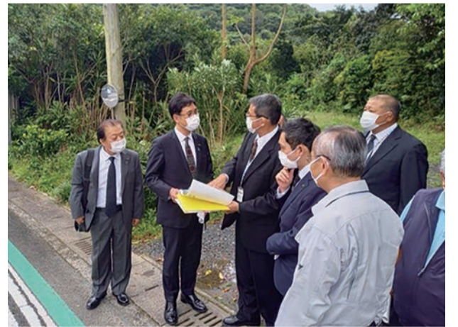
△和瀬バイパス視察