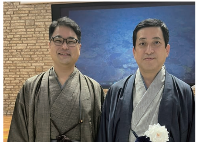
△奄美パーク開園20周年