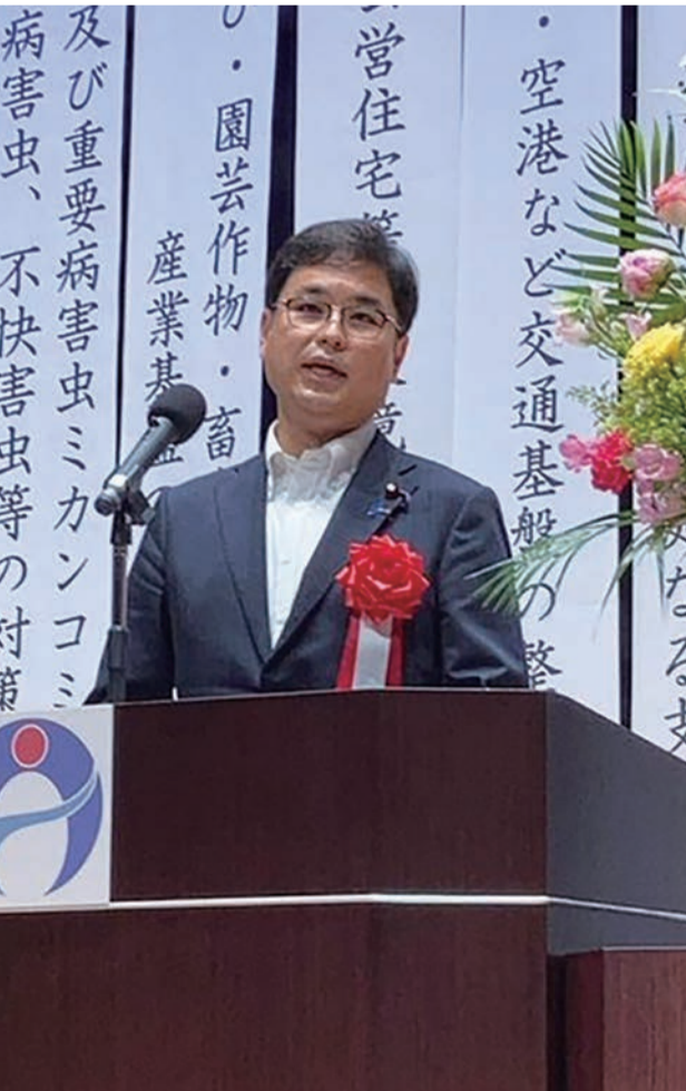
△奄美群島市町村議会議員大会にて