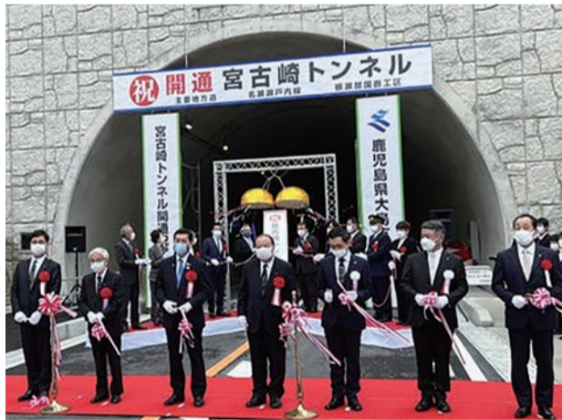
△大和村 宮古崎トンネル安全祈願祭・開通式