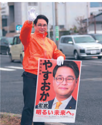
週末など時間がある時の辻立ちを継続中。お声がけを頂く機会も増えてきました。